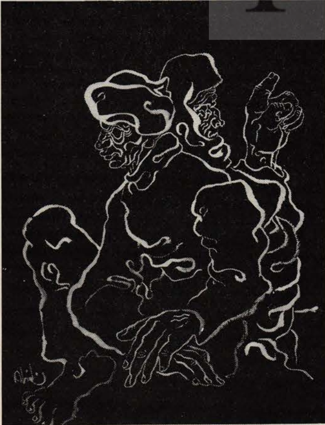
Desen (altta), Abidin Dino