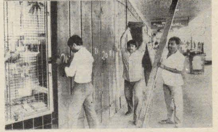
Başkent Suva'da darbeyi protesto için dükkanlar kapatılırken.

Demokratik seçimle işbaşına gelmiş olan hükümet