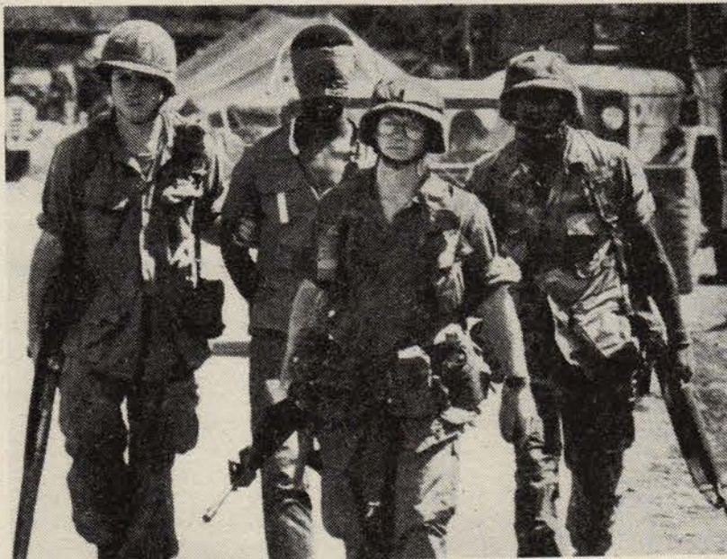
Grenada'ya "özgürlük" götüren Yankeeeler