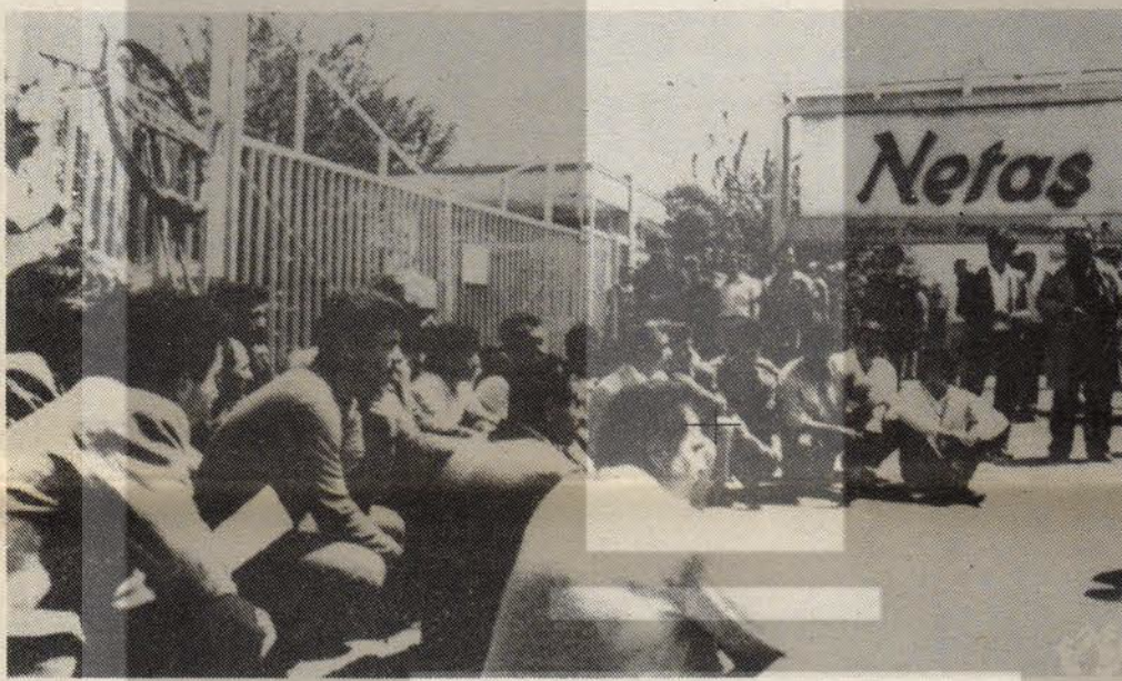
NETAŞ işçileri işten çıkarmaları protesto ediyor.

● Ziraat Bankası'na bağlı Türk-Otomotiv Endüstrisi A.Ş.'nin (TOE) Gebze'deki fabrikasında çalışan 550 işçi ücret ve sosyal haklarının uzun süre ödenmemesi üzerine açık