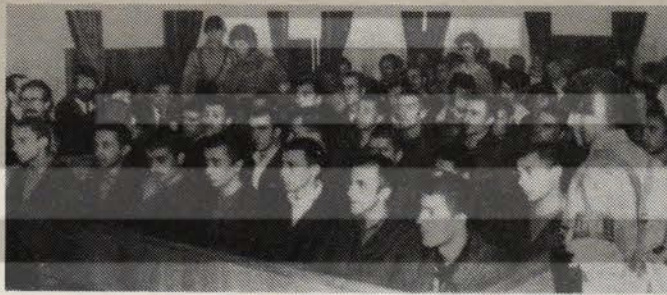
Direniş yapan öğrenciler DGM'de yargılanıyor.