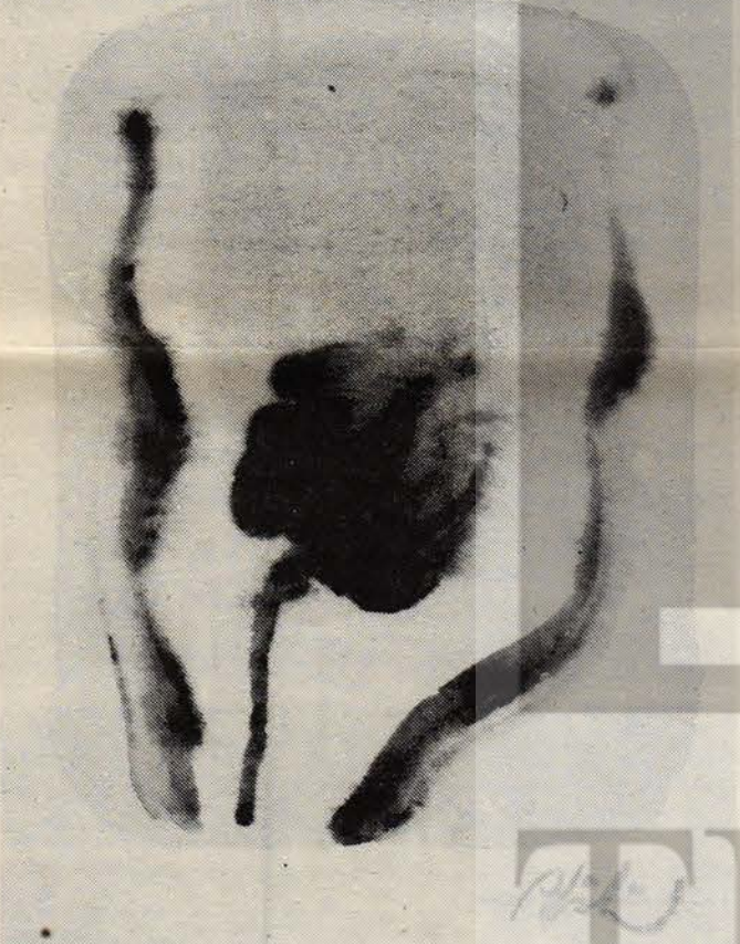
Pamuk dizisinden desen, Abidin Dino, suluboya

Bildirgede, "insanların hava gibi, su gibi en doğal haklarının gaspedilemeyeceği, düşünme, konuşma, örgütlenme ve benzeri demokratik hak ve özgürlüklerin ellerinden alınmayacağı, insanca, eşitçe, özgürce yaşanan bir Türkiye istiyoruz" denildi.