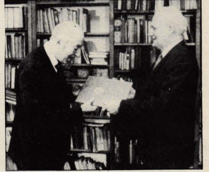
Kuczynski (solda) 80. doğumgününde Politbüro üyesi Günter Mittag ile.

Bu meseleyi kendime çok dert ediniyorum. Çıkarlarımız hâlâ, Dimitrov'un Komintern'in 7. Dünya Kongresi'nde ifade ettiği gibi, tekelci sermayeye değil, ama onun faşizmi ifade eden en gerici kesimlerine karşı cephe almayı gerektiriyor. Bugün durum şöyledir: ABD'de ekonominin üretkenliği hiç yükselmiyor, belki yüzde yarım ya da bir oranında yükseliyor. Bu eskiden yılda yüzde üç, dörttü. Bu bilim adamlarının yarısından fazlasının üretimin yüzde sekiziyle, yani silahlanmayla uğraşmasından kaynaklanıyor. Bilim adamlarının yarısından azı, ekonominin geri kalan yüzde 92'sinde istihdam edilmiş. Bu sivil sanayi etkiliyor.